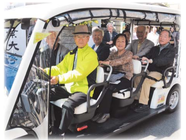
運転手は講習を受けたボランティアが担当しました

今後5年くらいしたら今自動車を運転している人もできなくなり、このような仕組みが今よりもっと必要とされるだろう。