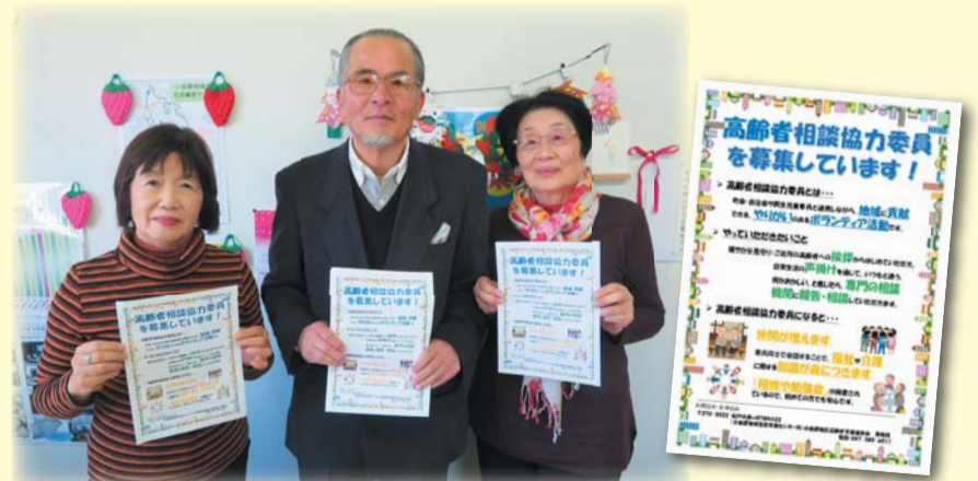
小金原地区高齢者支援連絡会のみなさん

小金原地区高齢者支援連絡会は、地域の高齢者の「見守り」や「声かけ」を行う高齢者相談協力委員の「募集チラシの作成」を依頼しました。