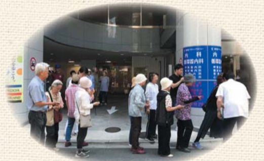
メディカルウォーキングの活動風景