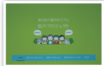
松戸プロジェクト HP のトップページ

松戸プロジェクトのホームページをリニューアルし、使い勝手の悪かった部分を改善しました。 https://www.matsudo-project.com にアクセスしてみてください。トップページの右下のブログというボタンをクリックすると、最近のニュースを見ることができます。