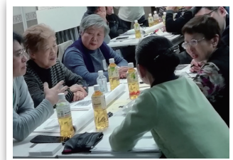
ワークショップの風景

また、協力団体・事業者による「通いの場」で役立つコンテンツの紹介は大変に盛況で、今後のパートナー活動として、ホームページやニュースレターによってこれらコンテンツの紹介に努めて行こうと思います。